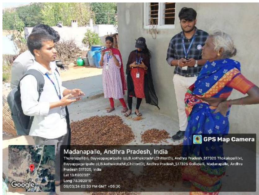
Madanapalle, Andhra Pradesh, India Thokalapalli(v), Bayyappagaripalle (p),B.kothakota(M),Chittor(D), Andhra Pradesh_517325 Thokalapalli(v), Bayyappagaripalle (p),B.kothakota(M),Chittor(D), Andhra Pradesh_517325 Gollasalli, Madanapalle, Andhra Pradesh 517325, India Lat 13.690235° Long 78.392018° 05/03/24 02:30 PM GMT +05:30