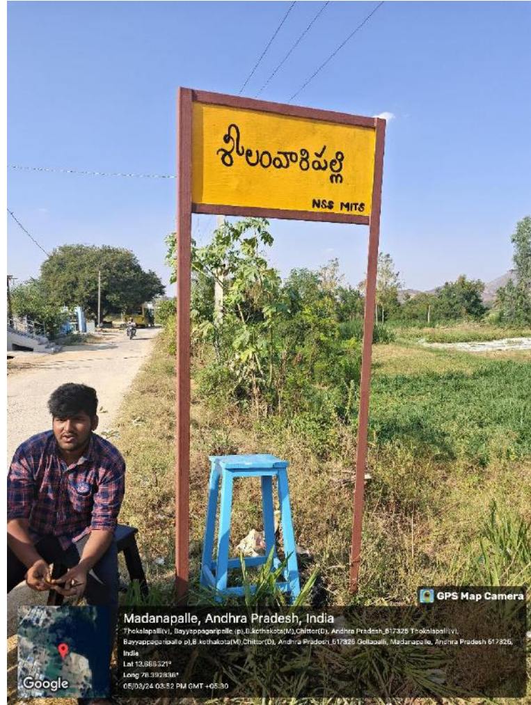
Madanapalle, Andhra Pradesh, India Thokalapalli(v), Bayyappagaripalle (p),B.kothakota(M),Chittor(D), Andhra Pradesh_517325 Thokalapalli(v), Bayyappagaripalle (p),B.kothakota(M),Chittor(D), Andhra Pradesh_517325 Gollasalli, Madanapalle, Andhra Pradesh 517325, India Lat 13.688321° Long 78.392836° 05/03/24 03:52 PM GMT +05:30